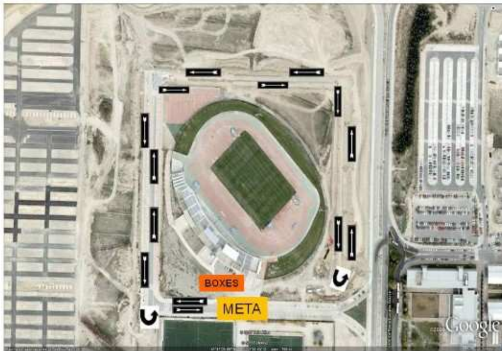
CIRCUITO DE CARRERA 2 3 VUELTAS GRANDES