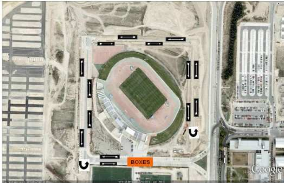
CIRCUITO DE CARRERA : 3 grandes