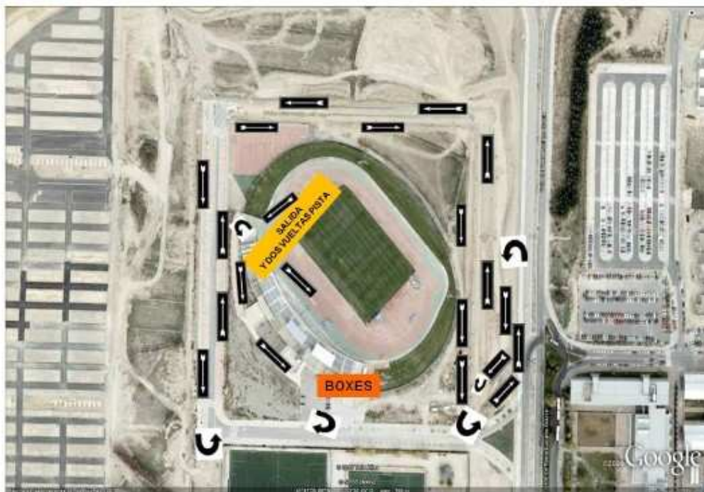
CIRCUITO DE CARRERA 1: 2 VUELTAS A LA PISTA – SALIDA POR PUERTA DE MARATHÓN + 5 GRANDES EN CIRCUITO EXTERIOR