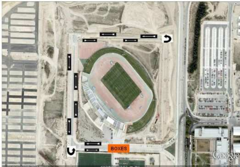
CIRCUITO DE CARRERA SPRINT 2º : 2 MEDIANAS